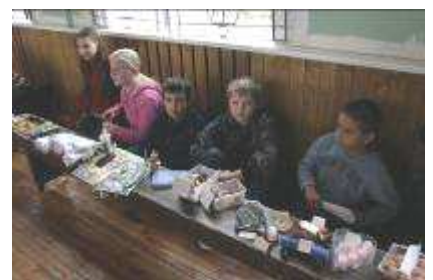
Tirgojās arī 5. b klases skolēni