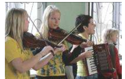
Ansamblis „Tarkšķi” iepriecina tirgus dalībniekus