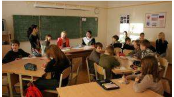
Skolēnu padomes sēde š.g. novembrī

Protokolēja Viktorija Kikste, Skolēnu padomes lietvede