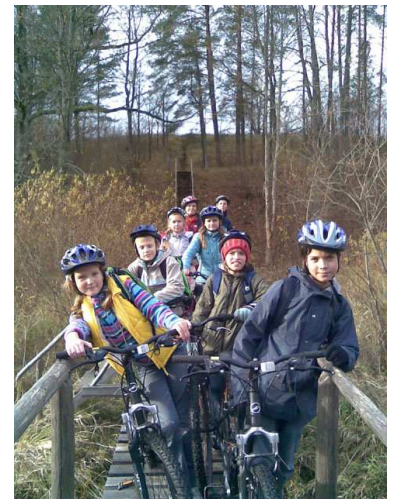
Pārgājiena dalībnieki uz Gulbju tiltiņa pāri Tērvetes upei