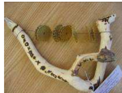
Mājas darbs olimpiādei. Skaņu rīks ar etnogrāfiskiem rakstiem.