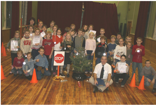
Sacensību dalībnieki un uzvarētāji