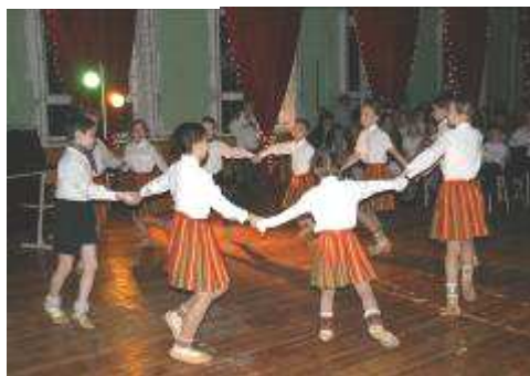
Tautas deju pulciņa dalībnieki, dejas „Vai priedīte, vai eglīte?”