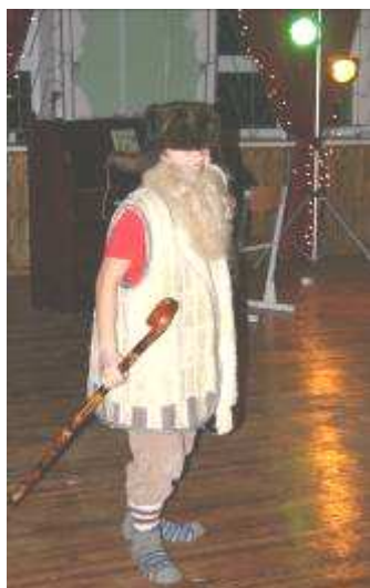
4. a klases uzveduma „Rūķīši un meža vecis” galvenais varonis