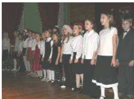
Skolas ansamblis „Garausi”