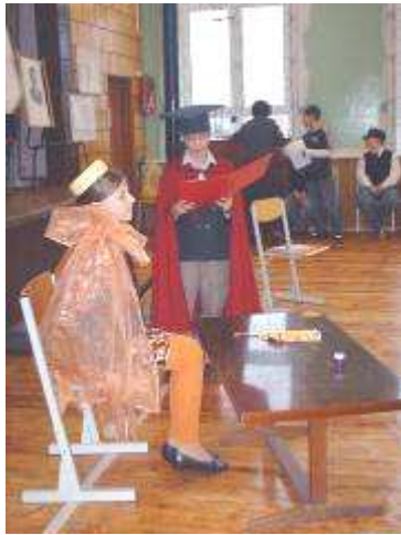
5. b klases uzvedums