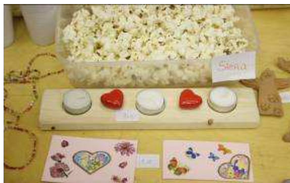
Tirgū varēja iegādāties skolēnu pašu darinātas lietas: apsveikuma kartiņas, māla figūras, rotaslietas, kārumus un mājturības stundās gatavotus svečturus.