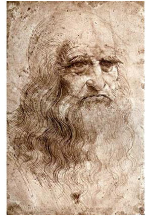
Leonardo da Vinči (1452 – 1519)

Leonardo da Vinči bija talantīgs itāļu arhitekts, anatomists, skulptors, inženieris, izgudrotājs, ģeometrijas pētnieks, zinātnieks, matemātiķis, mūziķis un gleznotājs. Viņš tiek uzskatīts par vienu no pasaules izcilākajiem gleznotājiem un dizinājiem ģenijiem.