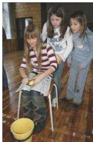
4. a klases meitenes kartupeļu mizošanas sacensībās.