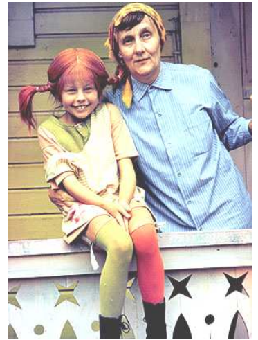
Astrīda Lindgrēne kopā ar kādu no Pepijas atveidotājām.